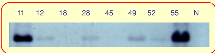
转基因小鼠 Southern 杂交鉴定结果